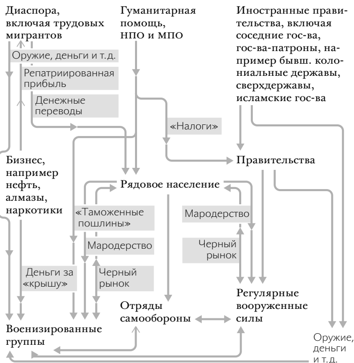
РИС. 5.2. Поток материальных средств в новых войнах

нитарной помощи. Прямая помощь от иностранных правительств, деньги за «крышу» от производителей сырьевых товаров и помощь от диаспоры увеличивают способность разнообразных боевых формирований извлекать из обычных людей еще больше материальных средств и таким образом поддерживать их военные усилия.