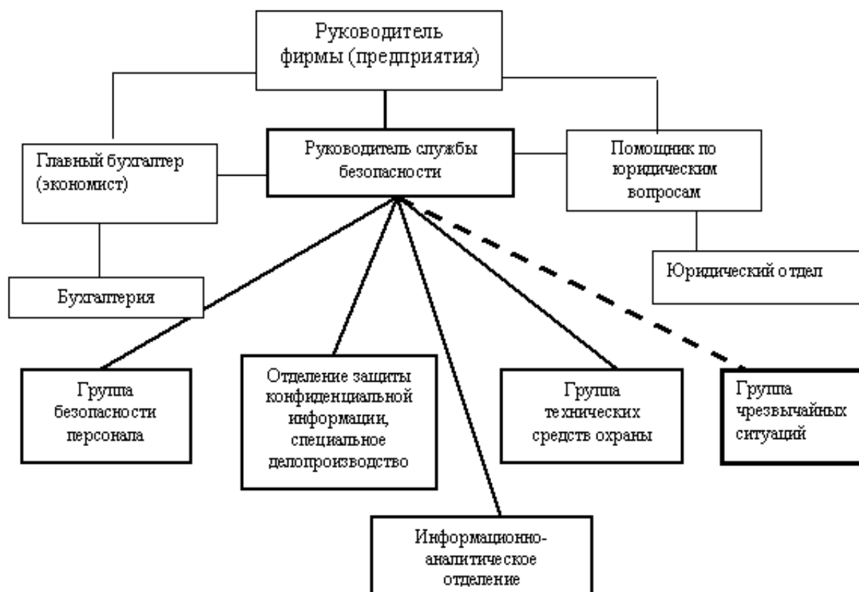
3.4.1-рисунок. Примерная структура службы безопасности

Особое положение в структуре СЭБ занимает группа чрезвычайных ситуаций. Предварительно следует сказать, что фирма, а значит и СЭБ, могут работать в двух режимах – обычном и чрезвычайном. При обычном режиме не возникает серьезных угроз экономической безопасности фирмы, идет профилактическая работа по их предупреждению и деятельность всех подразделений проходит в повседневном ритме. Возникающие проблемы и угрозы носят локальный характер и преодолеваются текущей работой подразделений фирмы, в том числе службой безопасности. При чрезвычайном режиме возникают неожиданные угрозы с высокой или значительной тяжестью последствий. В этом случае руководитель службы безопасности или руководитель фирмы собирает группу чрезвычайных ситуаций (кризисную группу), включающую наиболее