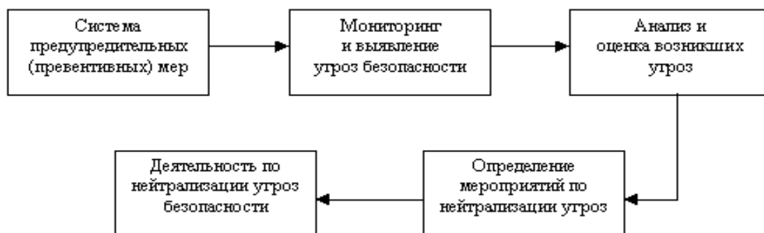
3.4.2-рисунок. Алгоритм действий службы безопасности предприятий.

Практическая деятельность службы экономической безопасности должна основываться на использовании типовых схем, процедур и действий. Прежде всего следует сказать об общем алгоритме действий, на котором основана работа службы безопасности. Он включает следующую последовательность операций: