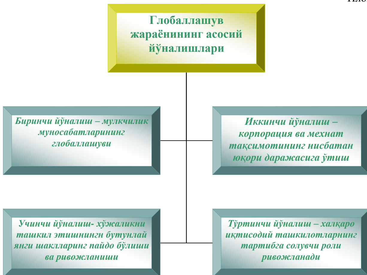
Илова - 9