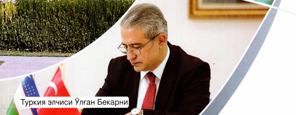
Туркия элчиси Ўлган Бекарни

ТУРКИСТОНДА МАҲАЛЛИЙ АҲОЛИ ВАКИЛЛАРИНИНГ ШАХСИЙ КУТУБХОНАЛАРИ ТАРИХИДАН