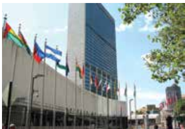
Штаб-квартира ООН. Нью-Йорк

После окончания Второй мировой войны (1939-1945 гг.) с целью поддержания мира и безопасности 24 октября 1945 года в Сан-Франциско (США) 51 государство подписало Устав ООН, который по праву можно считать Конституцией мира.