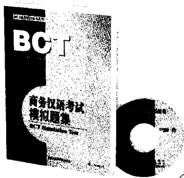
商务汉语考试模拟题集 张进凯 编