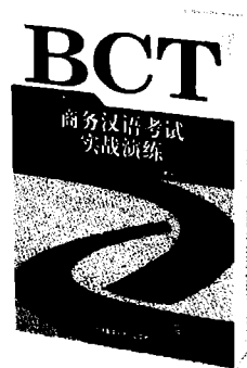
商务汉语考试实战演练 周虹 主编