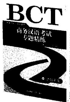
商务汉语考试专题精练（含学生用书、讲解用书） 郑丽杰 李玉梅 编