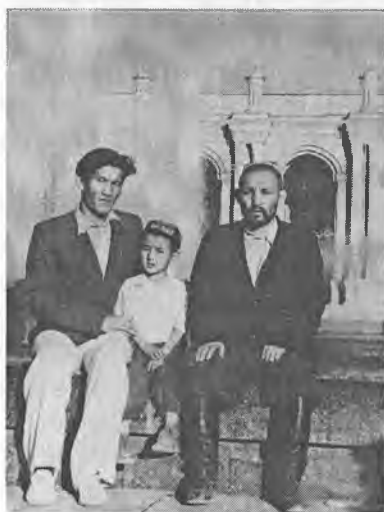
Талабалик йилларим. Отам ва укам Каҳрамон билан. 1954 йил.

Университетда ўқиш давримизда ўтиладиган фанлар бўйича бирор дарслик йўқ эди. Асосий манба