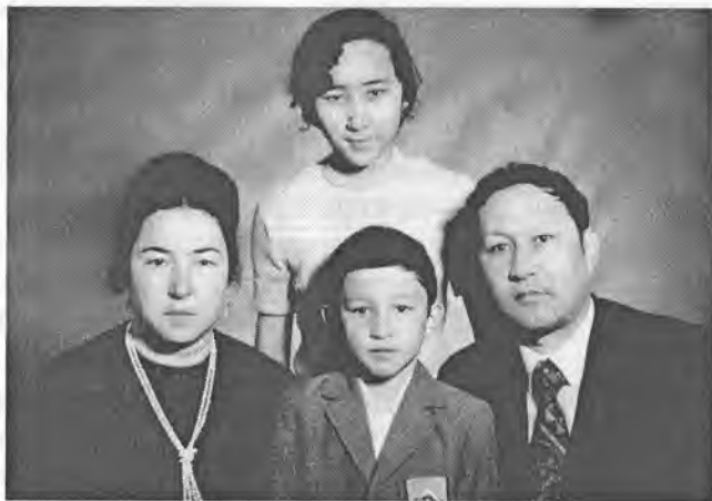
Оила аъзоларимиз. 1975 йил.