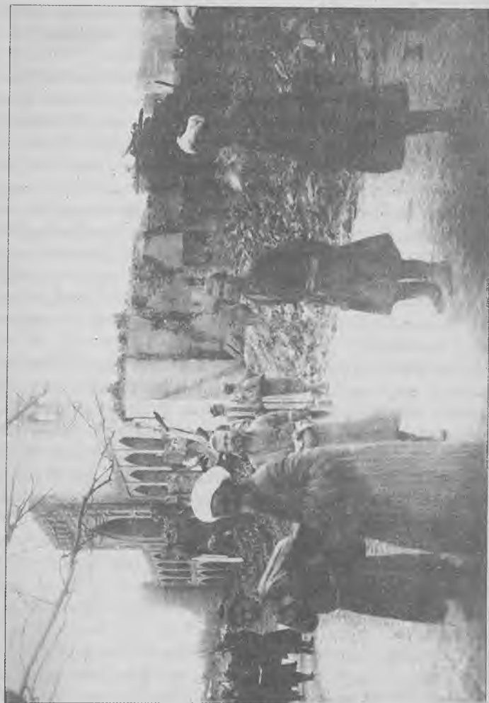
Кӯзон. 1918 йил, февраль.