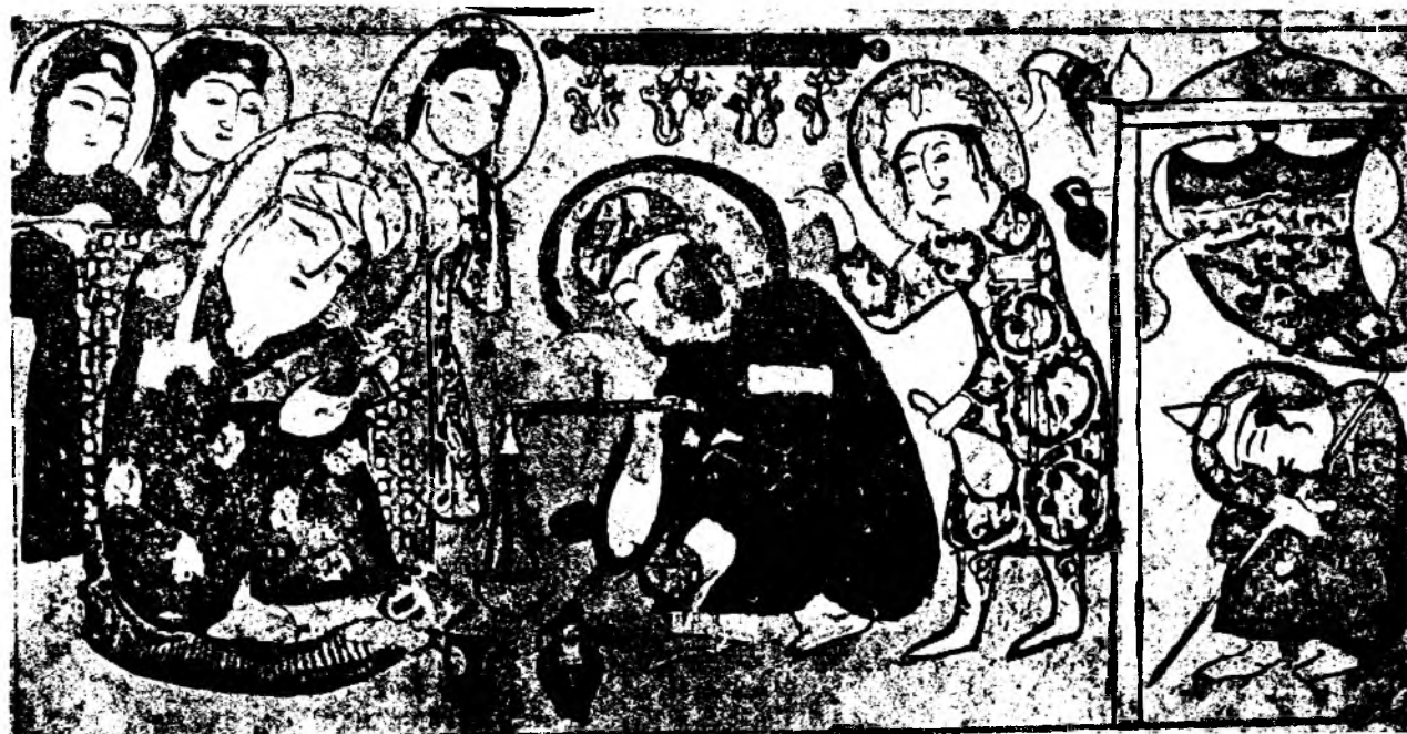
Приготовление терьяка. Из арабского перевода трактата Галена об электуариях, XII в. Хранится в Национальной библиотеке в Париже.