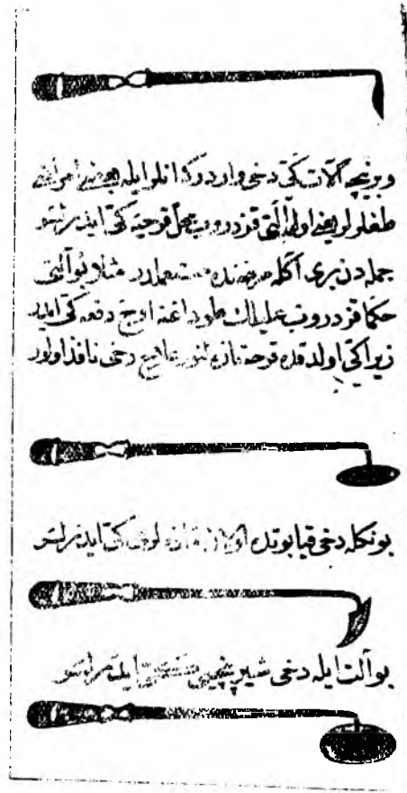
Прижигатели и инструменты. Из рукописи XVIII в. «Шифа ал-аскам» («Лечение болезней»). Хранится в Национальной библиотеке в Каире.