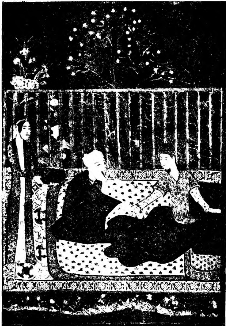
Прием у врача. Миниатюра из персидской рукописи, хранящейся в Британском музее.