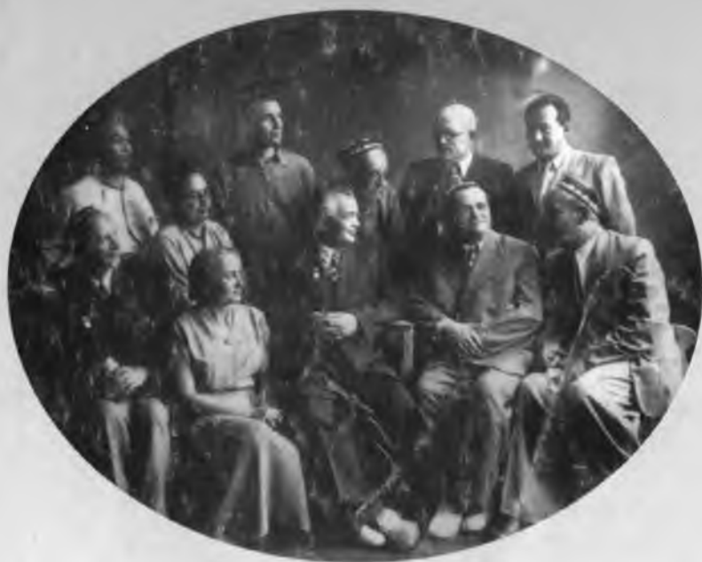
Абдулла Қаҳҳор ўзбек адабиётининг улкан намоёндалари— Ойбек, Ғафур Ғулом, Зулфияхоним ҳамда бошқа ижодкорлар даврасида