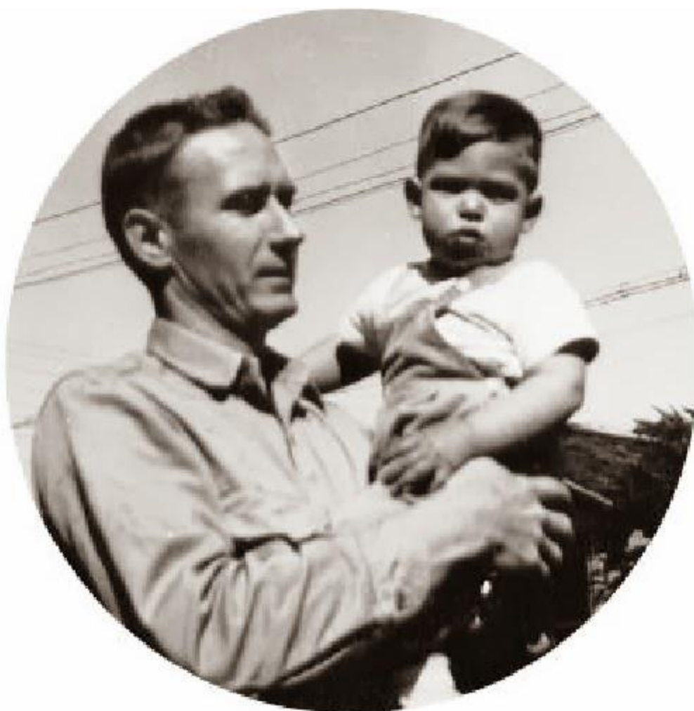
Пол Жобс ва Стив Жобс, 1956 - йил

камчиликлари ва ижобий томонлари бир бирига боғлиқдир, худди Apple компьютерлари ўз дастурига боғланиб қолганидек. Буларнинг ҳаммаси бир бўлиб бутун бир тизимни яратади. Жобснинг тарихи бир вақтнинг ўзида ҳам ибратомуз, ҳам одамни эҳтиёткорликка чорлайди. Бу тарих инновация, бошқаларга бўлган муносабат, лидерлик хусусиятлари ва инсоний кадриятлар ҳақидаги катта бир ҳаёт дарсидир. Шекспирнинг "Генри V" асарида ақлий жиҳатдан ўсмай қолган шахзода, отасининг ўлиmidан сўнг иштиёқли, аммо эҳтиросли; бешавқат ,аммо таъсирчан; ихлоскор лекин номукамал шохга айланиши ҳақида гап боради. Ёш қиролнинг муаммоси жуда оддий эди; у отасидан қолган меросни бошқариши керак эди. Ушбу асар шундай бошланади: "Оҳ, агар мен тассурот оламининг энг ёрқин нуқтасига чиқа оладиган илхом парисига эга бўлганимда эди." Стив Жобс учун "тасаввурот осмони"га кўтарилиш икки ота, икки она ва яқиндагина кремнийни олтинга айлантиришни ўрганган Силикон водийсида ўтган болалик билан бошланди.