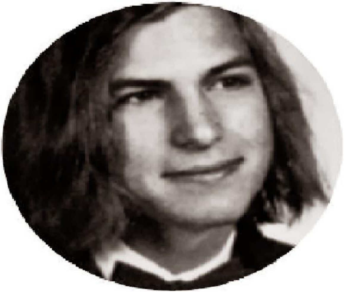
Хоумстеддаги мактаб битирувчилари албомидаги расм, 1972 - йил