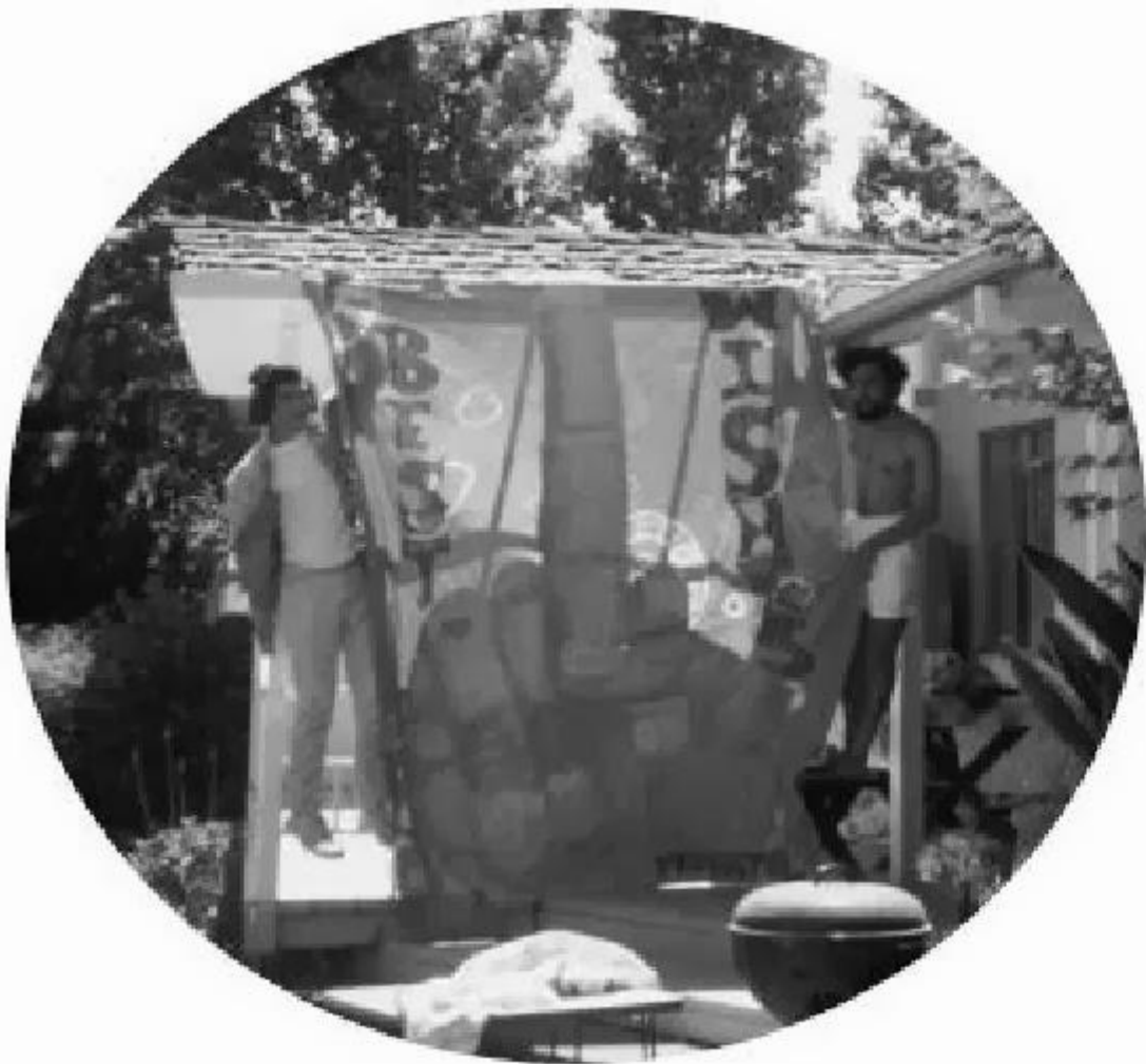
Мактабдаги байрам кечаси учун тайёрланган плакат билан