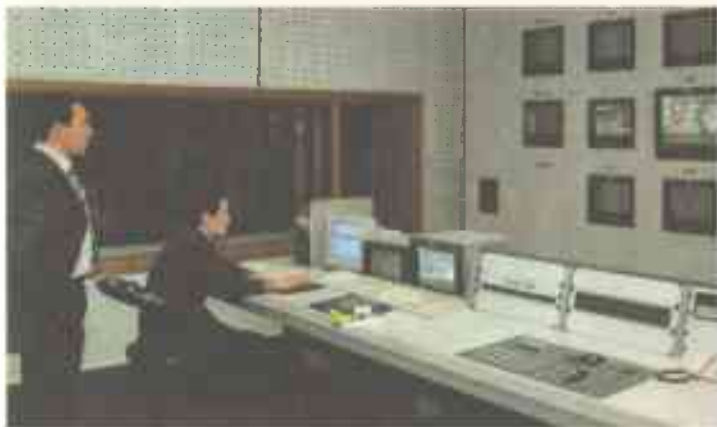
MTRK apparat studiyasida «Soliq xizmati» ko'rsatuvini yozib olish jarayoni.

Keyin meni FVV matbuot xizmatiga ishga chaqirishdi. Bu hayotimdagi birinchi haqiqiy omad edi. FVV binosi shaharning qoq markazida, hozirgi Senatning o'rnida joylashgandi. Bu vazirlikka kirish ham xuddi MTRK binosiga kirishdek qiyin bo'lgan. Ochig'i, men «Davr»dan hecham ikkilanmay, jon deb ketdim. FVVdan guvohnoma, forma berishdi, bosh mutaxassis lavozimiga tayinlashdi. Qanchalik omadim kelganini xayolga ham keltirish qiyin — men o'sha paytda o'zboshimchalik bilan «zachyor-cha»ga baho qo'yganim uchun institutdan haydalgandim.