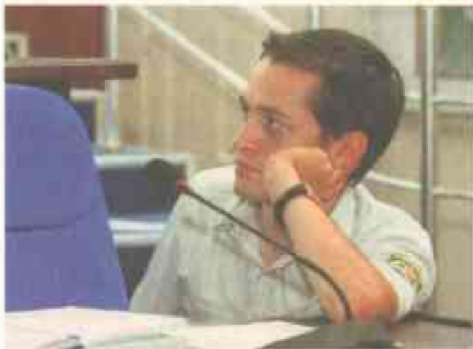
DSQning navbardagi kollegiya yig'ilishida.