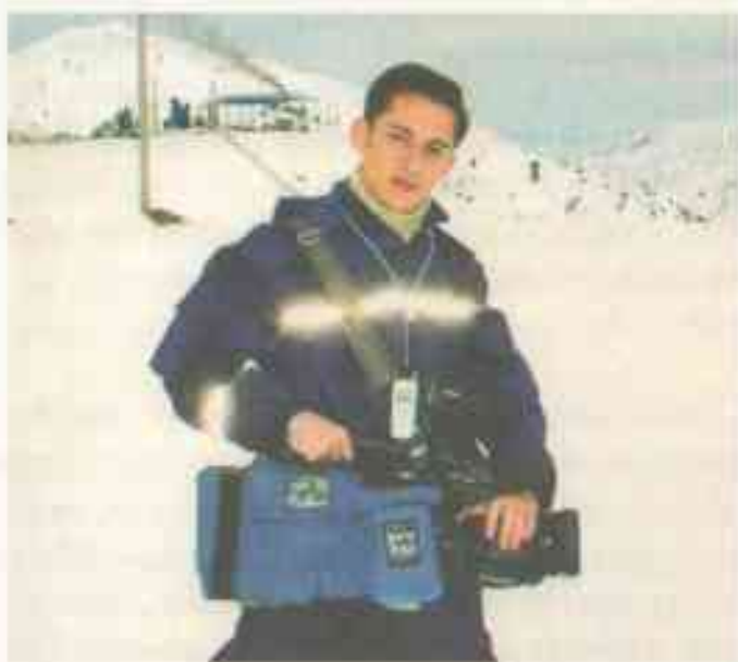
FVV matbuot xizmatida. «Qamchiq» maxsus qidiruv-qutqaruv boshqarmasi faoliyati haqida reportaj tasvirga olinyapti.

Bu shiddatli parvoz to'qqiz yil davom etdi. Shuncha yil har bitta ikir-chikirga e'tibor beradigan, talabchan perfeksionistning qo'l ostida jonimni berib, bayram, dam olish nimaligini bilmay ishladim. Yo hammasini qoyil qilib qo'yasan, yoki umuman keraging yo'q. O'shanda bir narsani sezganman — o'zimga dushman orttirishga usta ekanman. Bu «fazilatim»dan umr bo'yi qutulolmadim.