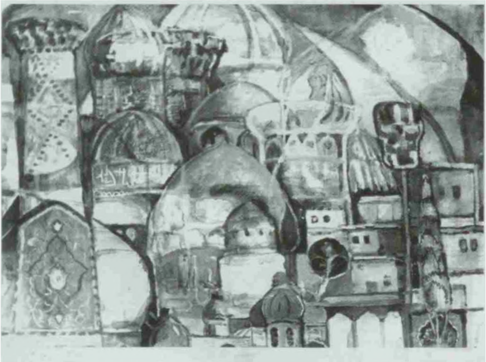
«Бухоро манзараси» картинаси