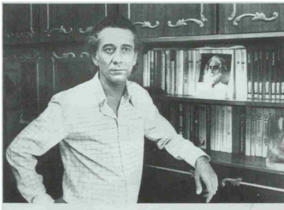
Китоблар — дил малхами