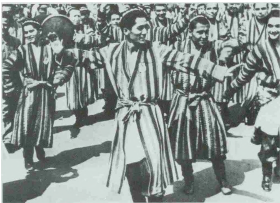
Москвада бўлиб ўтган Ёшлар фестивалида (сурат илк бор муаллифнинг шахсий архивидан берилмоқда.)