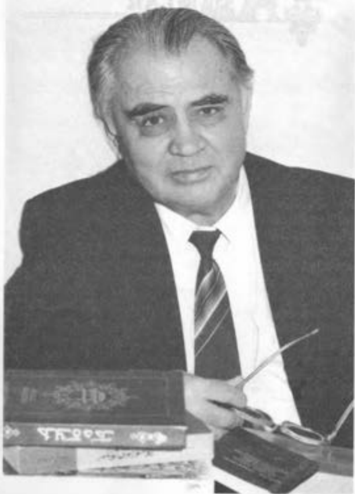
Portrait of a man in a suit, likely a faculty member or administrator, seated at a desk with books and a calculator. The background features a faint logo or emblem.