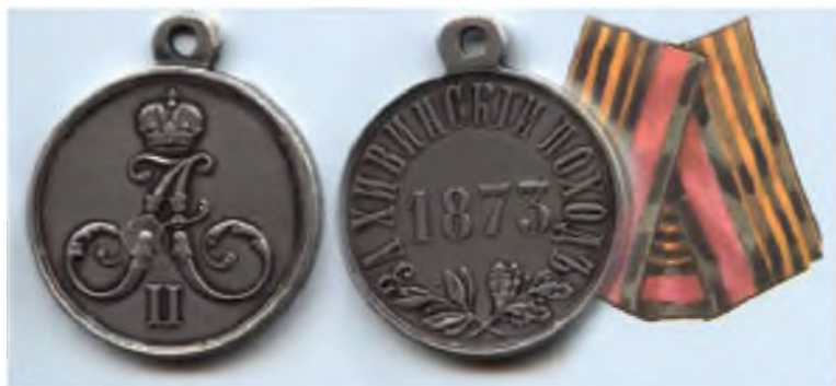
Медаль за Хивинский поход. 1873 год.