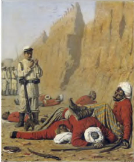
В.В. Верещагин. После неудачи.

приобретении колоний, о подавлении восстаний, об эксплуатации людских ресурсов и природных богатств. Точно также на Кавказе были ликвидированы в XIX веке мусульманские государственные образования на Северном Кавказе и 11 азербайджанских ханств на Южном Кавказе. Такова история, неважно, имеется