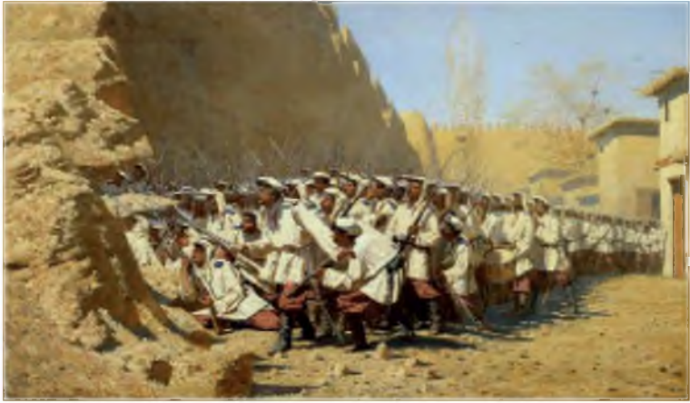
В.В.Верещагин. У крепостной стены.

против эмира Бухары Музаффара. Их целью являлся захват города и близлежащих к нему кишлаков. Музаффар-хан понял, что его военных сил недостаточно и обратился к жителям с призывом начать джихад .