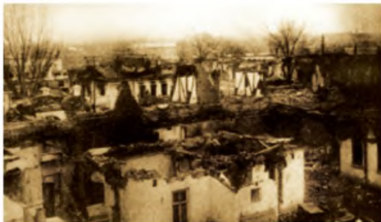
Разрушенные жилые дома. Ферганская долина. 1918г.

ственных выступлениях. Однако, большевикам, захватившим власть в России силой оружия, армяне были нужны, в первую очередь, именно из числа членов партии «Дашнакцутюн». Из них легко было подготовить террористов и карателей. И настраивали их, в первую очередь, против тюркоязычного мусульманского населения, как в Туркестане, так и на Кавказе.