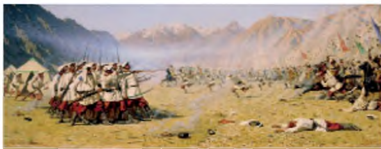
В.В. Верецагин. Нападают врасплох.

В это самое время в Самарканд прибыл знаменитый впоследствии военачальник М. Д. Скобелев, о котором в Туркестане сохранились самые негативные воспоминания. Он только что закончил Академию Генштаба и удостоился звания штаб-ротмистра. Договорившись с К. П. фон Кауфманом, А. К. Абрамов для быстрейшего подавления восстания создал карательный отряд под руководством М. Д. Скобелева. В него набрали в основном опытных казаков.