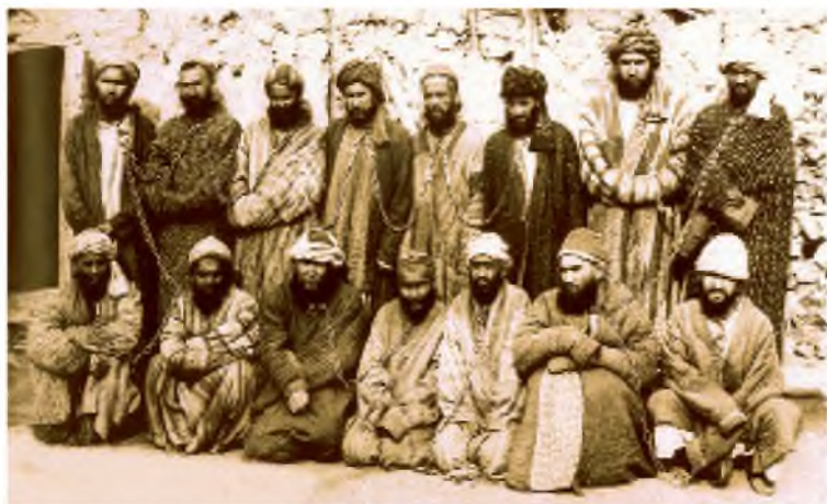
Участники восстания в цепях, перед каторгой.

Так, в 1904-1907 годы в Джизаке произошло народное восстание против российских колонизаторов во главе с Намаз Пиримкулом. Для того, чтобы сбить накал этого выступления, власти засылали в его ряды шпионов, дезорганизаторов, провокаторов и убийц, которые убили Намаз Пиримкула.