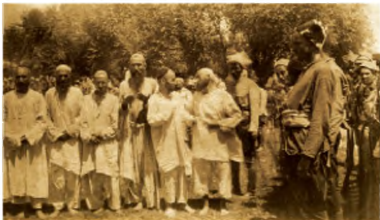
Участники Национально-освободительного движения перед казнью.

К началу 1920-х годов против Национально – освободительного движения Туркестана были сосредоточены значительные силы красной армии. Её численность достигала почти 100 тыс. активных штыков. Им противостояли в этот период 60 тыс. повстанцев, в том числе в Ферганской долине – 26 тыс. 83