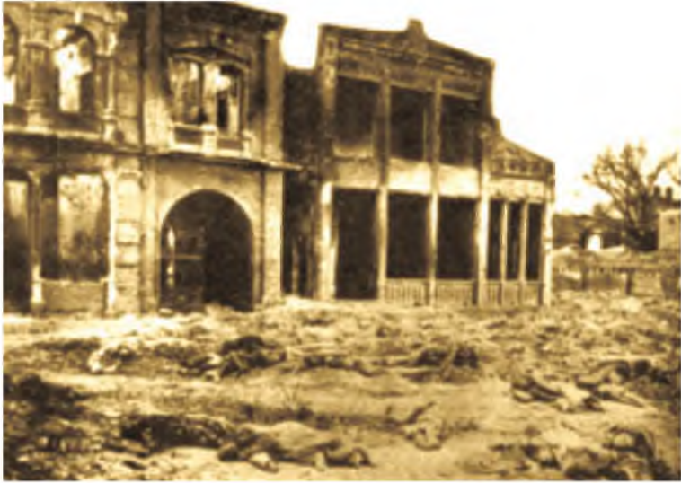
Коканд, после резни. 1918 г.

цутюн» на советской территории запретили. Как говорится, «Мавр сделал своё дело, Мавр должен уйти!»