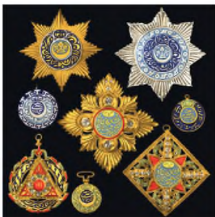
ОРДЕНА И МЕДАЛИ БУХАРСКОГО ЭМИРАТА. Конец XIX-начало XX века.

Орден Благородной Бухары (1-золотой, 2-серебряный, 3-золотой знак) учрежден бухарским Эмиром Музаффаром в 1881 г., имел восемь степеней: две наивысших в виде золотого знака с алмазами и золотого знака с бриллиантами, три золотых знака и три серебряных. Орден «Корона Бухарь» (4, 5) – второй высший по достоинству орден был учрежден