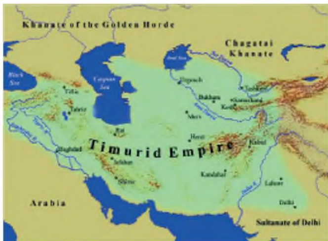
Империя Эмир Тимура.

Тимур хотел этим подчеркнуть, что это – не просто главный город его им-