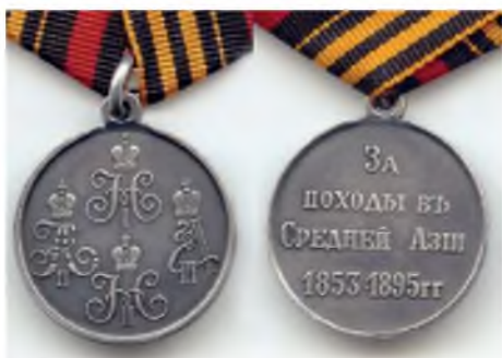
Медаль за походы в Средней Азии. 1853-1895 годы.

крепости Учкурган. В ночь на 28 января 1876 года, отправленный М. Д. Скобелевым отряд захватил Учкурган, все его защитники были перебиты. Пулат-хан успел бежать, но был пойман в Маргилане.