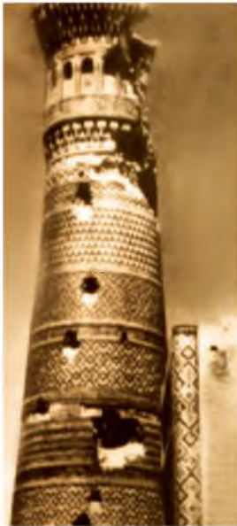
Обстрелянный минарет Калян в Бухаре.

Ташкент в 1920 году-Центральное бюро партии младобухарцев-революционеров.