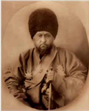
Хивинский хан Мухаммад Рахим-хан Феруз II

ский и Оренбургский. В конце февраля – начале марта 1873 года они под командованием К. П. фон Кауфмана начали наступление сразу с нескольких сторон: из Джизака, Казалинска и с Каспийского побережья. Красноводский отряд не дошёл до пункта назначения. Тем не менее, в середине мая 1873 года другие отряды подошли к Хиве.