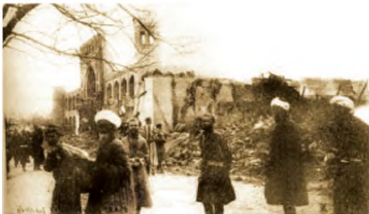
Разрушенная мечеть. Коканд. 1918 г.

ние 1918-1919 годов не только истребляли местных жителей, но также разграбили и уничтожили почти все города в Ферганской долине и 180 селений. В одном только Коканде за три дня они убили 10 тыс. человек, в Маргилане – 7 тыс., в Андижане – 6 тыс., в Намангане – 2 тыс., в местности между Базаркурганом и Кокандом – 4,5 тыс. мирных жителей. Также сообщаются о жертвах в селах, где были полностью истреблены местные жители. По сообщениям узбекского историка К.К. Раджабова вырезано 2 тыс. местных жителей старого города Ош и расчленены тела детей. В городе Чуст вырезано 1,5 тыс. мирных жителей.