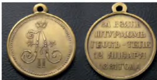
Медаль за взятие штурмом Геок-тепе

...Надо всем этим воздыма- лось русское знамя, неясно различаемое сквозь дым, лениво разве- вавшееся и ка- завшееся ка- ким-то громад-