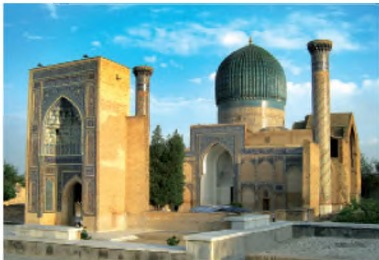
Самарканд. Гури Эмир. Мавзолей Тимура.

Свою столицу Самарканд он превратил в один из красивейших и известнейших городов мира. Сюда приезжали за помощью и защитой многие правители Востока. Преемники Тимура в XV веке сделали Восток мусульманского мира очагом блестящей культуры. Тогда стали известны выдающиеся достижения в области тюркской, иранской и арабской литературы, архитектуры, живописи и в книжном деле. Один из внуков Тимура – Улугбек, правивший в 1409-1449 годы, приобрёл известность не столько своей государственной деятельностью, сколько тем, что при нём Самарканд превратился в крупный центр научной и культурной жизни Востока. Он прославился как великий астроном, который трудился в возведённой им в Самарканде обсерватории. В тимуридскую эпоху жили и творили поэты Джами, Алишер Навои, художник Бехзад и многие другие авторы бессмертных произведений.