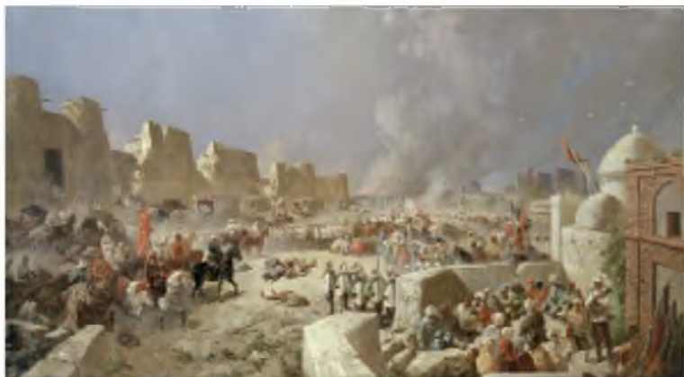
Н. Н. Каразин. Вступление русских войск в Самарканд 8 июня 1868 года.

лаконичную записку на крошечном кусочке бумаги: «Мы окружены, штурмы непрерывны, потери большие, нужна помощь».