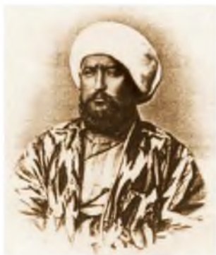
Худаяр-хан Кокандский хан.