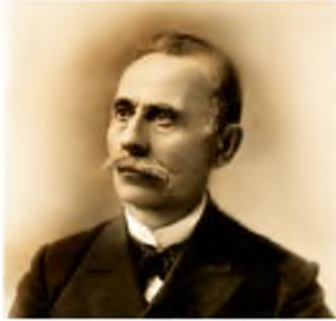
Исмаил бей Гаспралы. Основоположник Джадидизма.