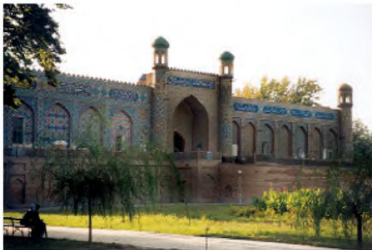
Коканд. Дворец хана. Орда.

Поэт Хусейн Шейх (литературный псевдоним «Камина»), очевидец сражений у Ясси и Чимкента, составил поэтические и исторические очерки этих событий. В частности, он отметил, что русские солдаты, в отличие от кокандских воинов, «стреляли без промаха и залили всё кровью», а простой народ, плохо владевший оружием, «стал мишенью для врага».