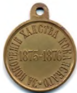
Медаль за покорение Кокандского ханства. 1875-1876.

В ответ, по инициативе М. Д. Скобелева, против восставших было организовано новое наступление на Андижан. 8 января 1876 года город подвергся беспощадной бомбардировке и был разгромлен. Погибло 20 тысяч андижанцев. 27 На следующий день М. Д. Скобелев вошёл в разгромленный и обезлюдевший Андижан, Пулат-хан с выжившими воинами ушёл к