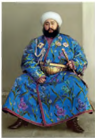
Бухарский эмир. Сейид Алимхан.

Все эти события сблизили младобухарцев с большевиками, часть их вошла в состав бухарской компартии. В 1918-1919 года Ф. Ходжаев работал в Наркоминделе РСФСР и организовал в Москве отделение младобухарской партии, а по приезде в