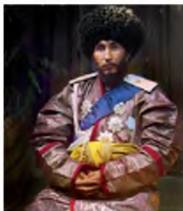
Хивинский хан Исфандиярхан. Фото Прокудина- Горского.

Большевики в 1929, 1937-1938 годы приступили к физическому уничтожению местной интеллигенции, а также к ликвидации всех программ джадидского движения. В такой ситуации радикальная часть джадидов, не согласных с колониальным режимом, эмигрировала из Туркестана. Другая часть джадидов для защиты Родины от фактического агрессора – советской власти, оккупировавшего Туркестан, взялась за оружие и вли-