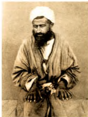
Дукчи Ишан. Предводитель восстания.