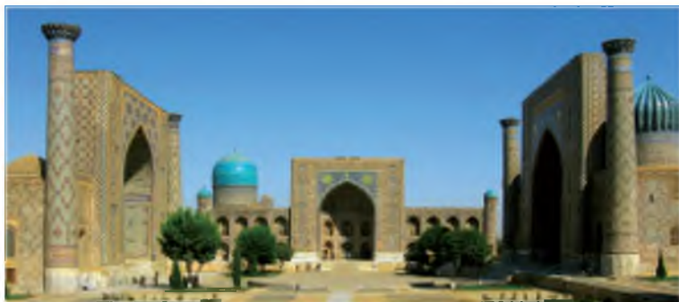
Самарканд. Площадь Регистан.

Среди тех, кому Тимур помог в военно-политической карьере был известный хан Золотой Орды Тохтамыш (1376-1395 годы), из рода Чингиз-хана. Тимур отчески позаботился о Тохтамыше, помог ему военной силой стать во главе Золотой Орды. Однако Тохтамыш оказался неблагодарным. Он намеревался захватить Южный Кавказ, хотя Тимур считал его своим владением, Тохтамыш неоднократно вторгался туда. Более того, Тохтамыш в 1388 году выступил против самого Тимура, хотя только благодаря ему получил трон Золотой Орды в 1376 году. Он вторгся в Мавераннахр, в ответ на что Тимур совершил против Тохтамыша три похода – в 1389, 1391 и 1394-1395 годах. Тимур разгромил Золотую Орду, покорил её столицу Сарай-Берке и другие города, в том числе Хаджи-Тархан (Астрахань) и Азов. 18 июня 1391 года Тимур разгромил Тохтамыша в кровопролитной и упорной битве. Дальнейшая жизнь Тохтамыша прошла в скитаниях, а «улус Джучи», известный как Золотая Орда, где властвовал некогда Тохтамыш, после этого, в результате внутренних конфликтов распался на мелкие государства. 4