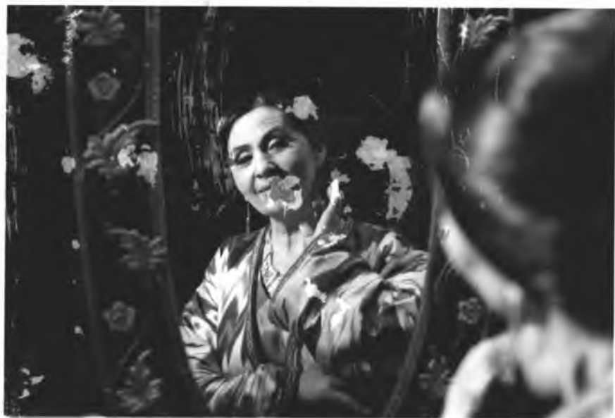
Вақт ўтганини, ҳимр чопанон. Ивланганли ислаб потанон...