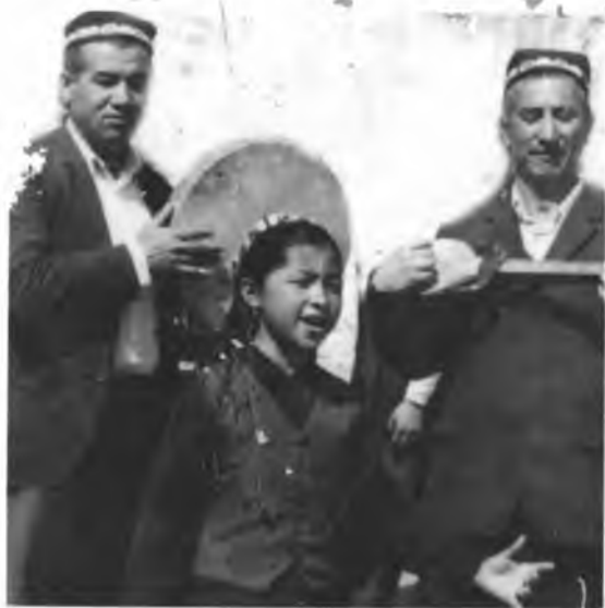
Ёшлигим, кел, куйга тўдган Қалбим олтин сўзи бўл