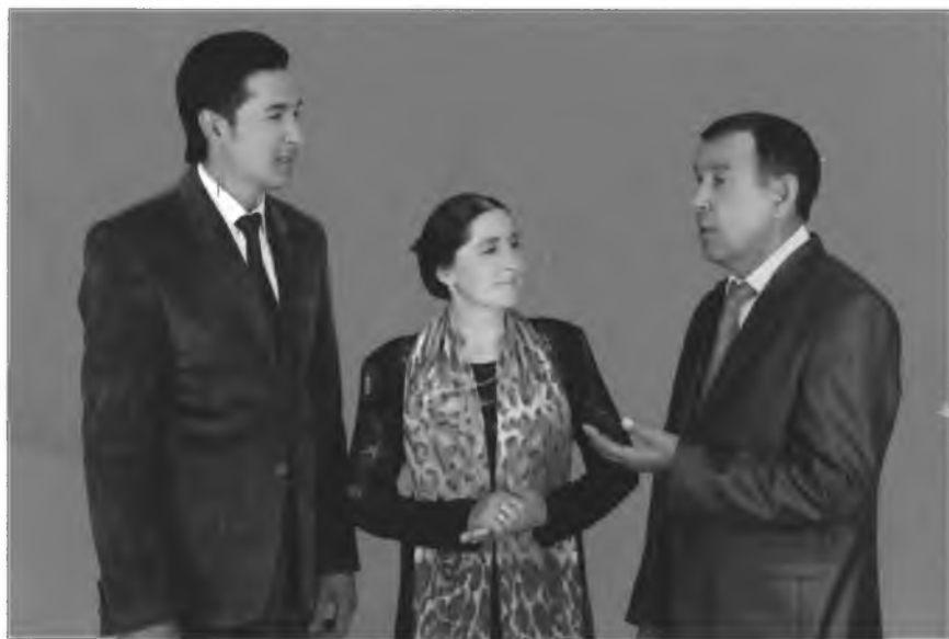
Ихлосбекка санъат сирларини ўрганишида оиласининг ўрни катта