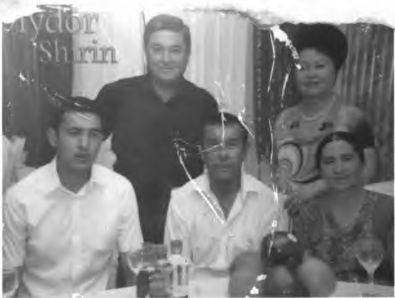
Севимли санъаткорлар “Дийдор ширин” кўрсатувида