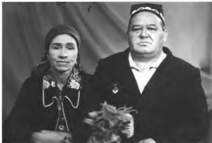
Рахмонали ота ва Хосият она, Бири ойдир, бири куёш, - парвона.