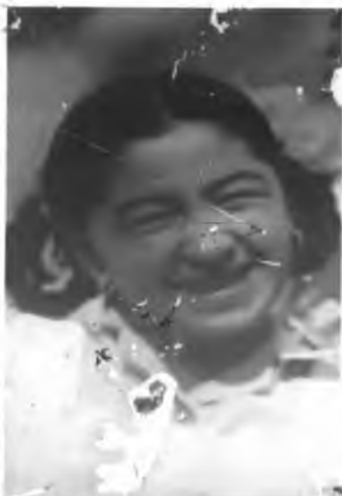
Саннат йўлига тушим. 1974