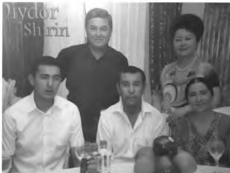
Севимли санъаткорлар “Дийдор ширин” кўрсатувида