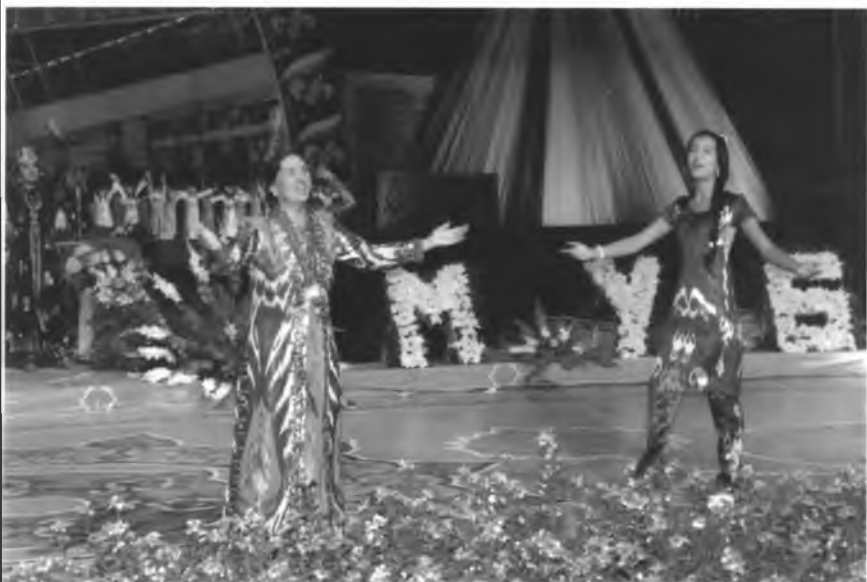
Андижоним, гўзал шаҳрим гулларга консан