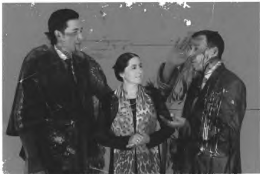
Ихлос билан саъятчиларини ўрганиши ва олий санъатнинг ўрни катта Санъатнинг сеҳридан хушнуд эл-халким