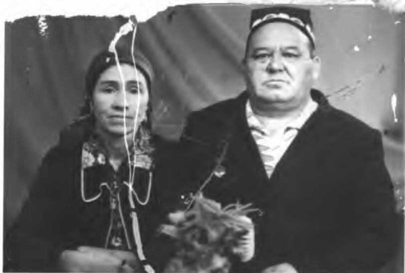
Рахмонали ота ва Хосият она, Бири ойдир, бири куёш, - парвона.