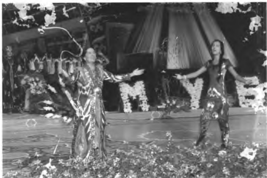
Андижоним, гўзал шаҳрим гулларга консан