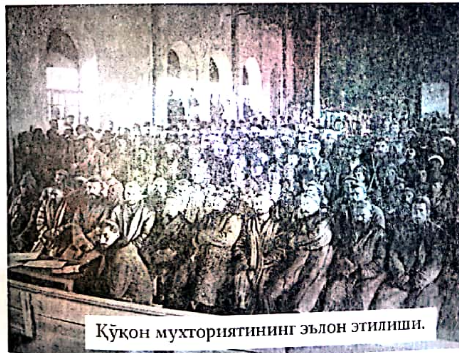
Қўқон Туркистон пойтахти этиб тайинланди. Муваққат ҳукумат раҳбарлари ҳам Туркистон озодлиги-

1917 йил феввалида Русияда инқилоб юз берди. Оқ пошшо ҳукумати ағдарилиб, Керенский раҳбарлигида эркпарастлар муваққат ҳукумат тузишди. Бундан фойдаланиб, Туркистон ҳам ўз озодлигини эълон қилди.