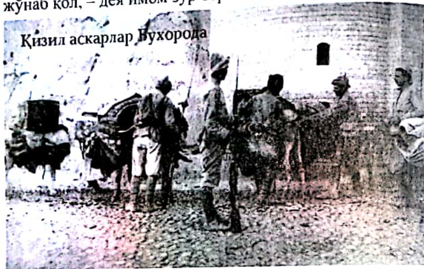
Қизил аскарлар Бухорода

– Ўзбекман. – Сенга бу ерга киришга ҳам рухсат йўқ, яхшилиқча жўнаб қол, – дея имом зўр бериб бақирди.