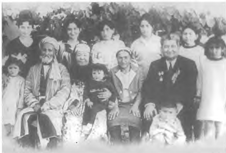
1971 йил ноябрь. Шаҳрисабз. Ота-она, жуфти ҳалол ва фарзандлар билан.