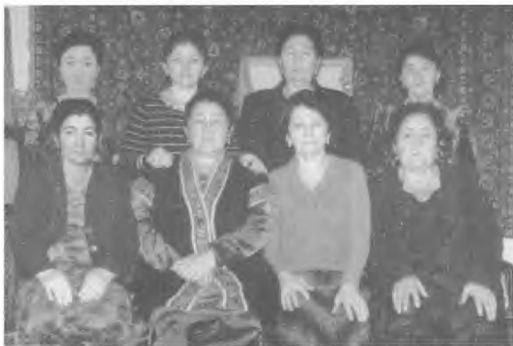
Бахтларини толиб, ўзларидан тиниб ва қўпайиб кетган меҳрибон қизлар.