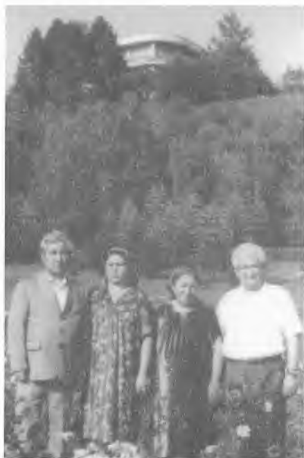
1982 йил. Кисловодск. Икки яқин оила бирга дам олишда.