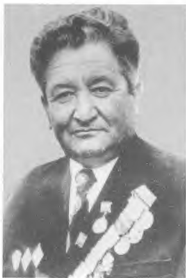
Қарши чўлларида жавлон урган йиллардан эсдалик.