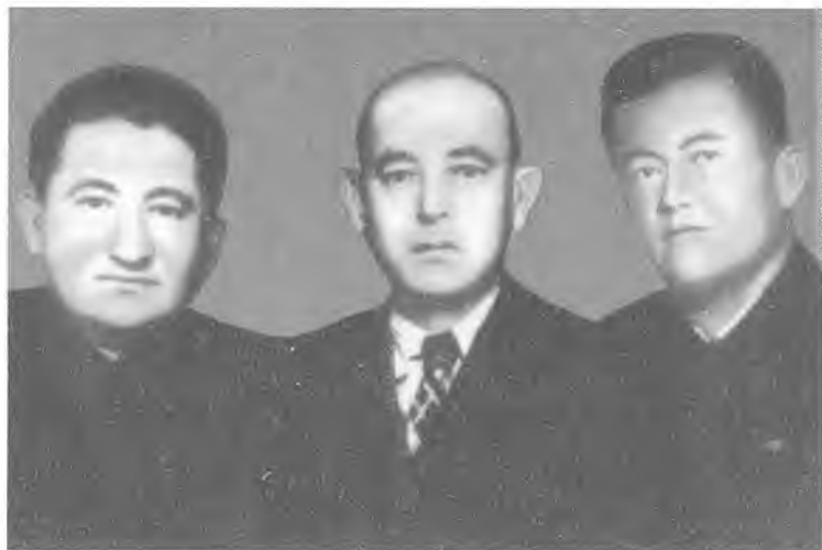
Деҳқонобод туманида ишлаган йиллардан эсдалик.