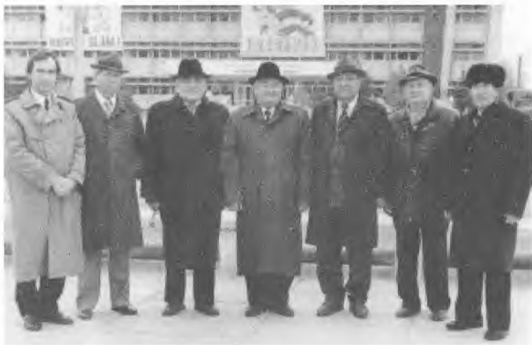
1999 йилнинг Наврўз кунлари қадрдонлар даврасида.