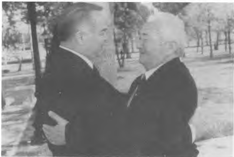
Қадрдонлик қалбан бўлганда! (Президент Ислам Каримов ва Соиб Усмонов).