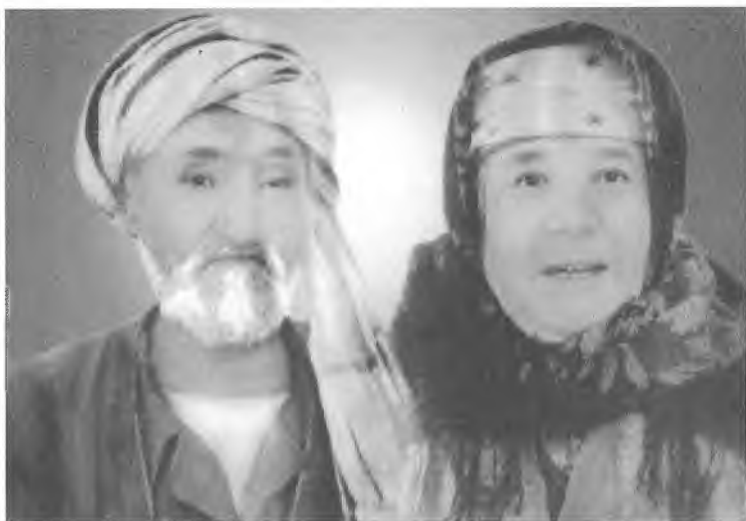
Падари бузруквор Усмон ота ва волидаи муҳтарама Ҳайитой она.