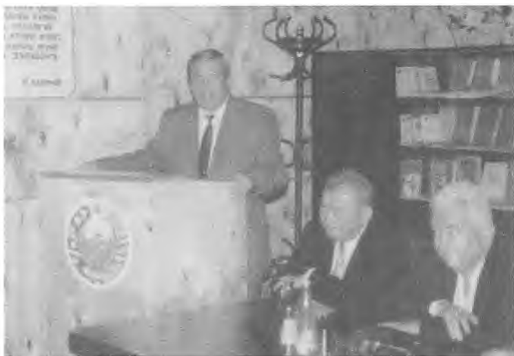
Унинг билан бўладиган учрашувларда вилоят зиёлилари ана шундай фаол иштирок этишарди.