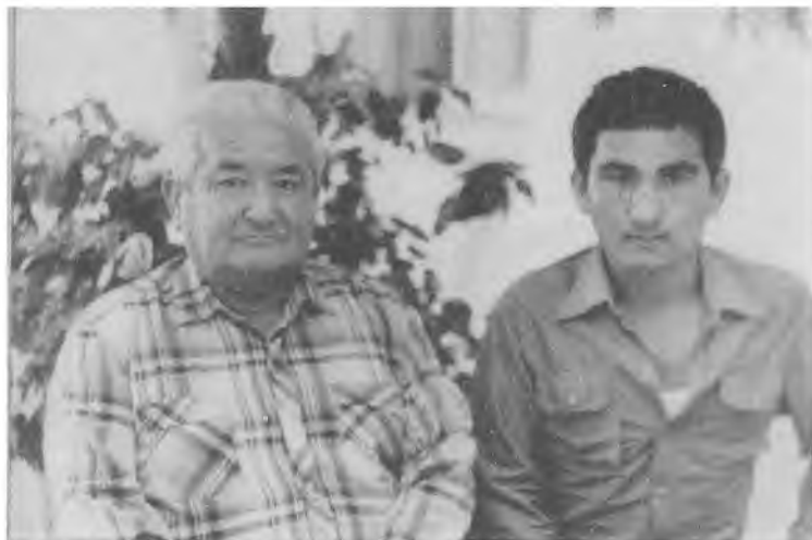
«Шавкатим» деб суйган катта ўғил билан.