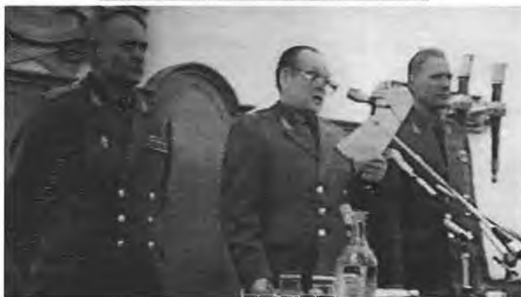
Хукмнинг ўқилиши (1985 – 1986 йиллар).