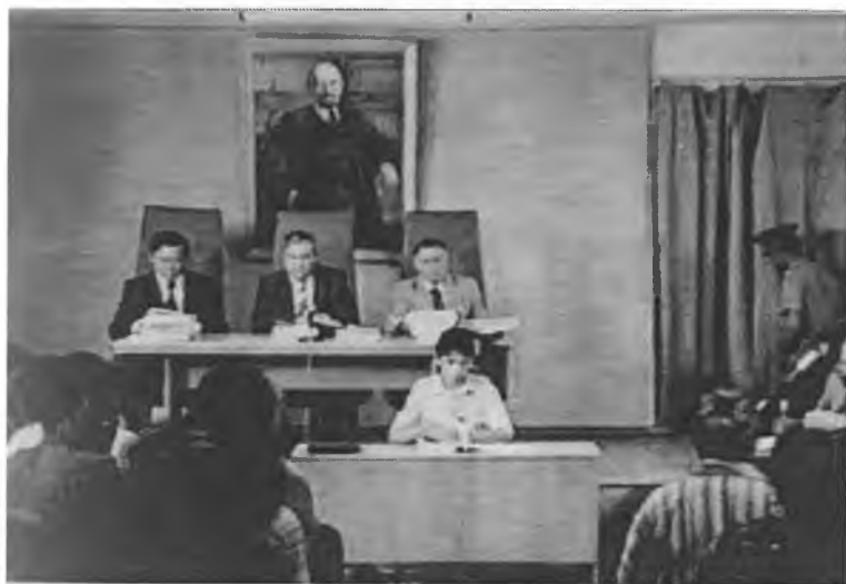
Ноқонуний қамоққа олинган кишилар орасида кўп болали оналар, ҳомиладор аёллар, ёш болалар, қариялар ҳам бўлган (1985–1986 йиллар).