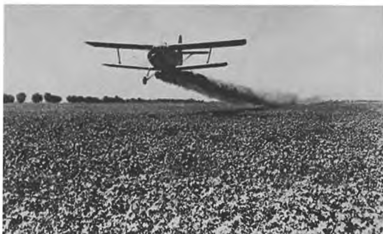
Пахта даласига зарарли пестицид сепилмоқда (80-йиллар).