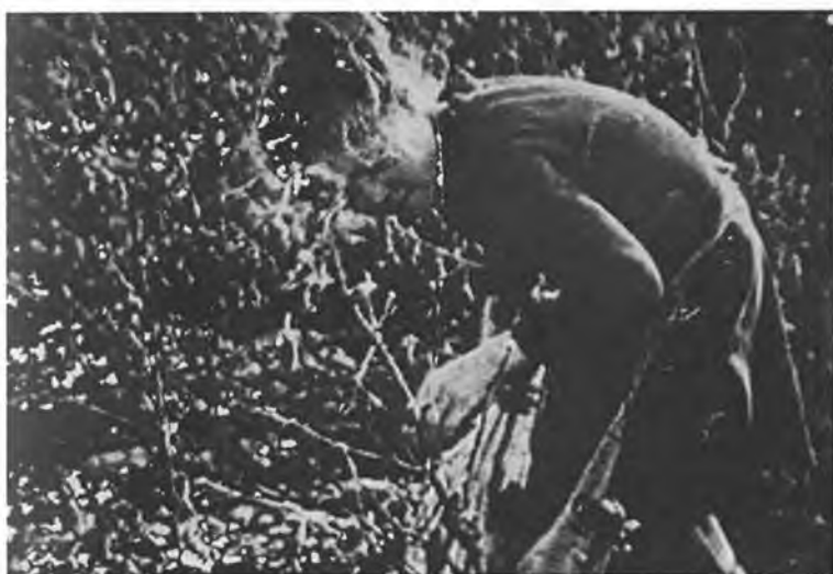
Пахта даласида оғир меҳнат (80-йиллар).