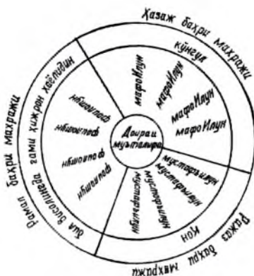
6-жа д в а л

Ушбу доираи муъталифадан ташқари доираи мутта- фиқа, доира мужталиба, доираи мужталибаи музоҳафа , доираи мужталибаи мухтараа , доираи мухталифа, дои- раи муштабиҳо, доираи муштабиҳои солим, доираи