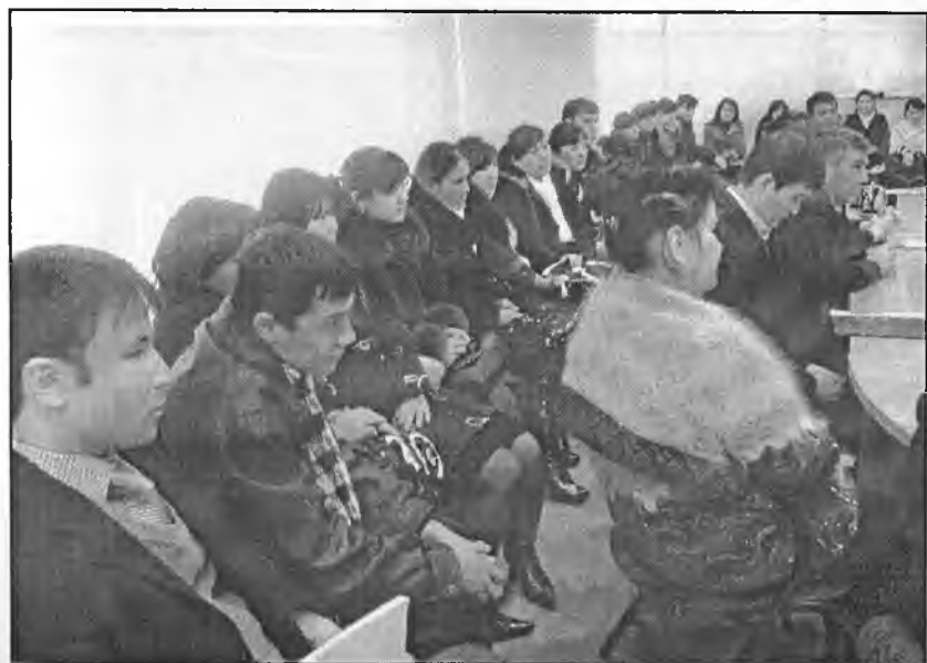
Анжуманда фаол иштирок этган талабалар