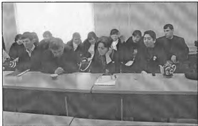
Анжуман ишидан лавҳа