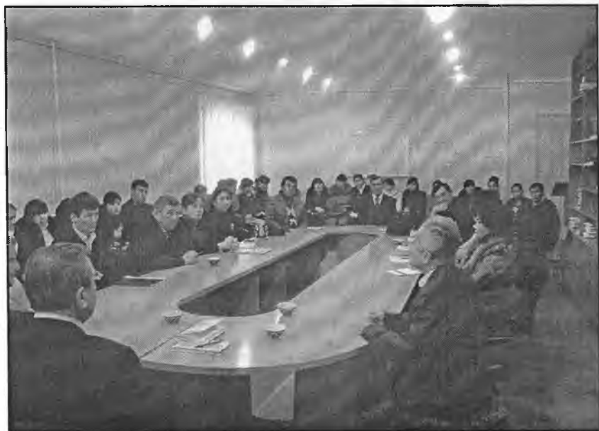
«Адабий таълим ва ёшлар тарбияси» анжуманидан лавҳа