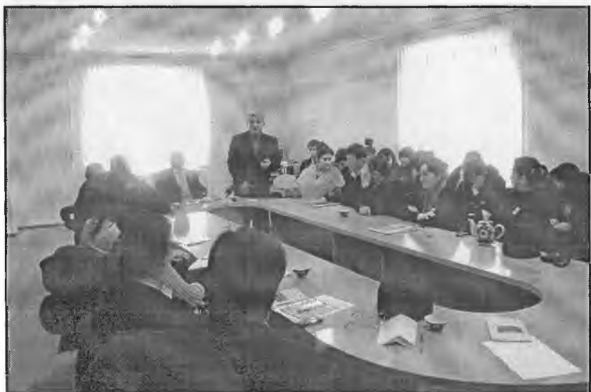
Йирик Навойшунос олим Ё.Исҳоқов Навойни англаш ҳақида маъруза қилмоқда