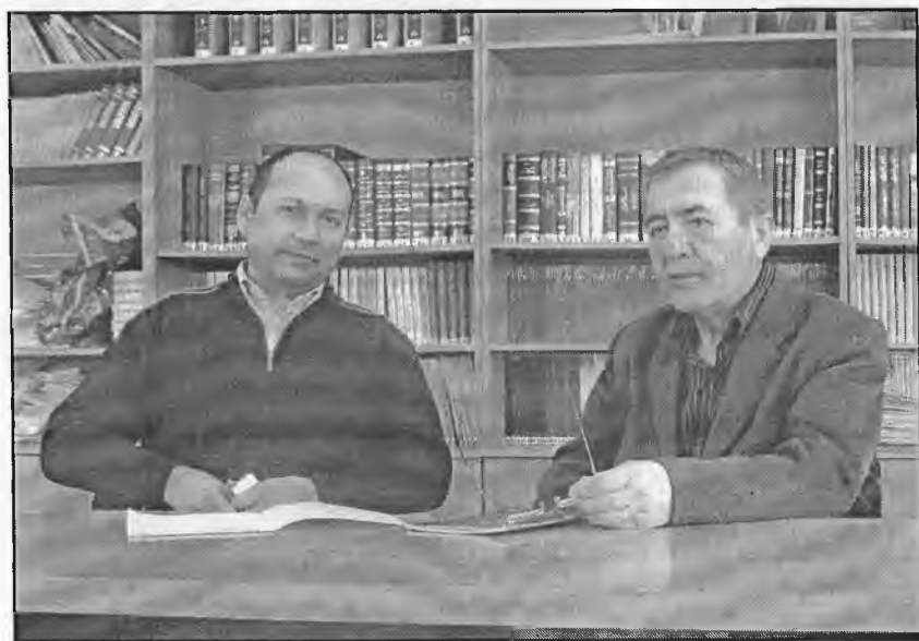
Диққат эътибор маърузага