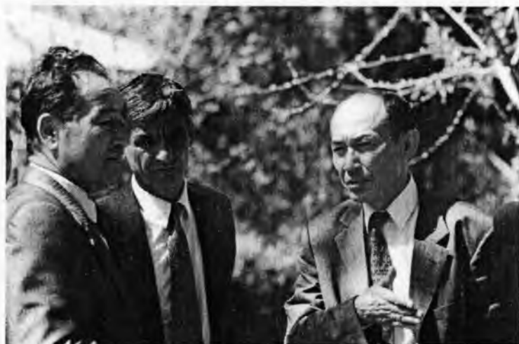
Сен баҳорни соғинмадингми?