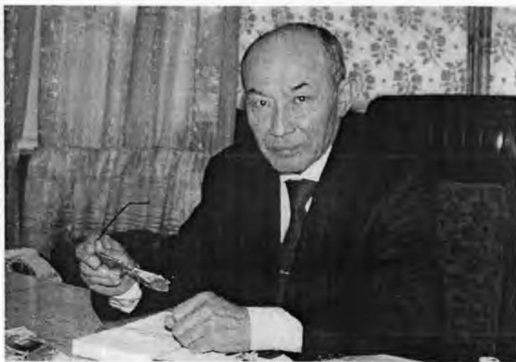
Ўйчан ижод онлари