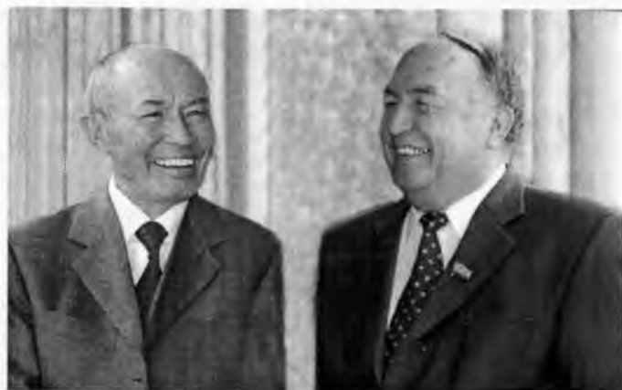
Шоир кулса, олам кулади