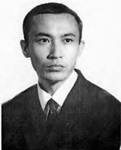
Эх, менинг ёшлигим!