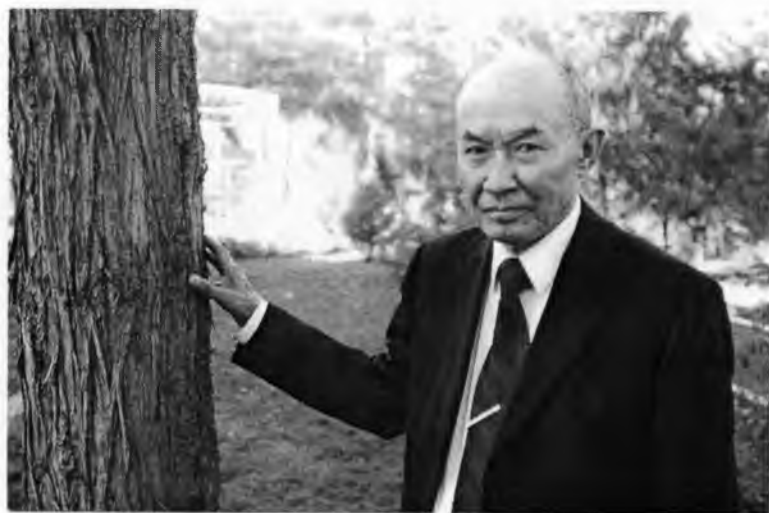
Умринг фалсафий лаҳзалари