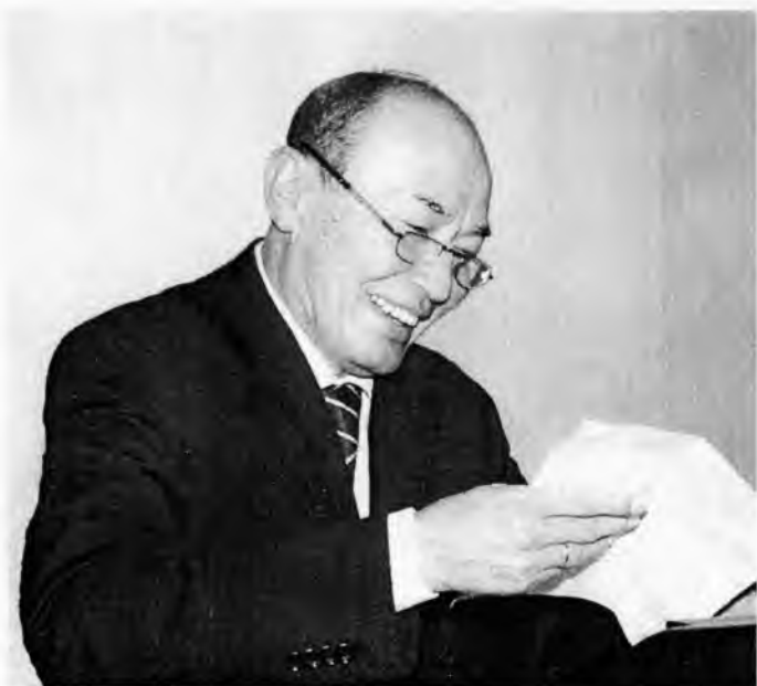
Мухлислар саволига жавоб бериш лаззати