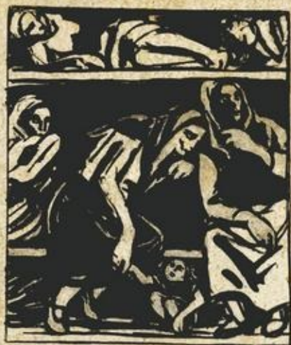
Набросок к картине «В женском лагере»