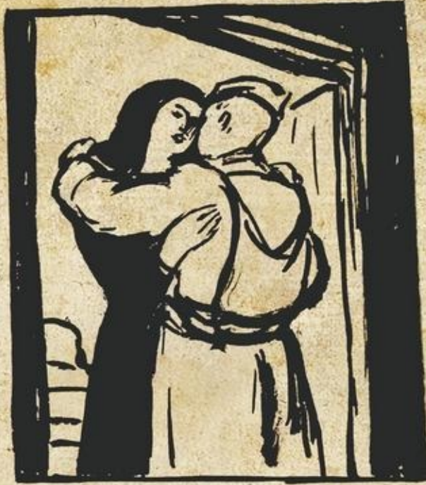
Иллюстрация к книге Г.Смоляра «Мстители гетто» 1946