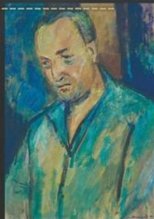
«Узник. Портрет Александра Печерского» картон, темпера, 75X50, 1969