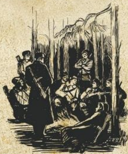
«У костра» иллюстрация к книге М. Лева «Партизанские тропы»