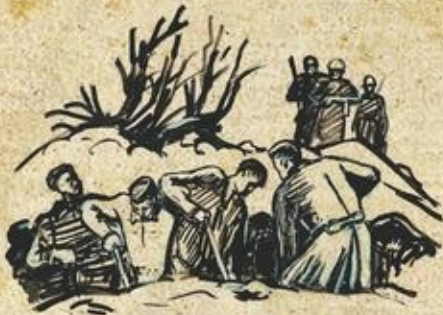
Иллюстрация к книге М. Лева «Партизанские тропы» 1958