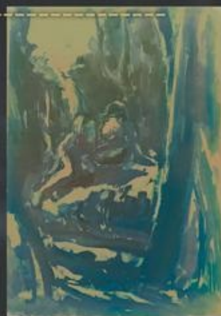
«Дети, прячущиеся в лесу» бумага, гуашь, 44X30,5, 1945