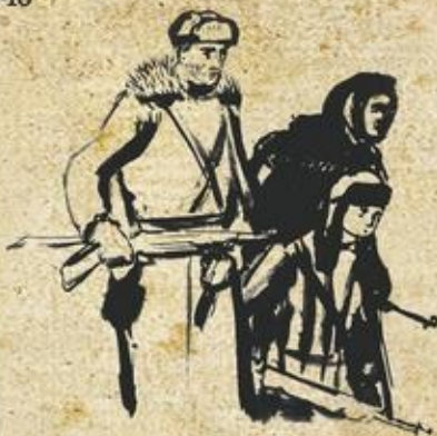
Иллюстрация к книге Г.Смоляра «Мстители гетто» 1946