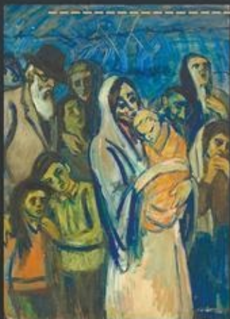
«Старики. Женщины. Дети» картон, темпера, 81X61, 1964