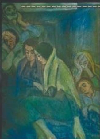
«В укрытии» картон, темпера, 100X80, 1965