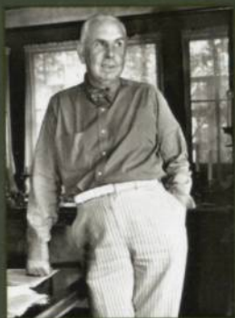
Теодор Драйзер 1871–1945

Америкалик ёзувчи Теодор Драйзер 1871 йил 27 августда Индиана штатига қарашли Терре Хот шаҳарчасида таваллуд топган. Ёзувчининг «Титан», «Даҳо», «Америка фожиаси», «Бахти қаро Керри», «Ўн икки йигит» ва бошқа асарлари дунёга машҳур. Қўлингиздаги адибнинг «Сармоядор» романи таниқли таржимон Амир Файзулла таржимасида эътиборингизга ҳавола этилмоқда.